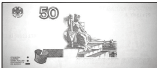
50 рублей мод. 2004 г.