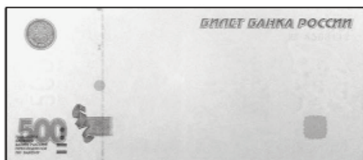
500 рублей мод. 2001 г.