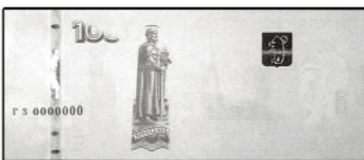
1000 рублей мод. 2010 г.