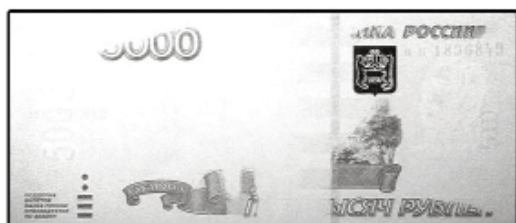
5000 рублей обр. 1997 г.