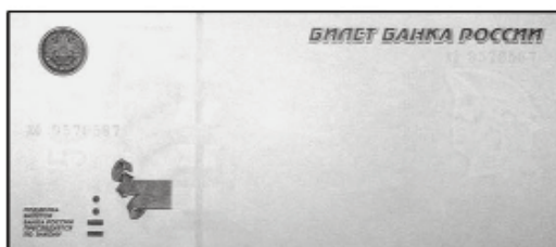
500 рублей мод. 2004 г.