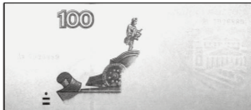
100 рублей мод. 2004 г.